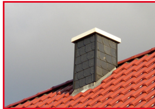
Schornstein optional Variante Schiefer