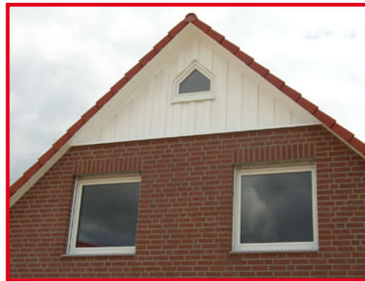
Variante Giebel dreieck mit Holzverschalung