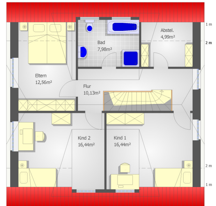
Wohnfläche DG ges.: 68,54m 2