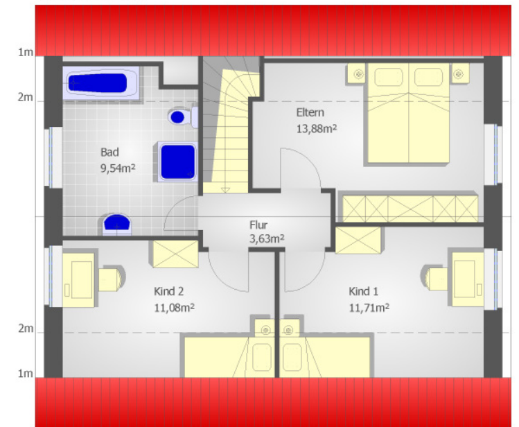
Wohnfläche DG ges.: 49,84m 2